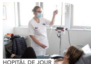
HOPITAL DE JOUR

L'oncologie médicale est composé d'un plateau de consultation, d'hospitalisation de jour et de semaine, de lits dédiés aux essais précoces, d'un hôpital de jour soins de support.... Les oncologues médicaux travaillent de manière étroite avec les autres départements.