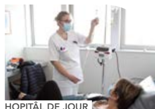
HOPITAL DE JOUR

L'oncologie médicale est composé d'un plateau de consultation, d'hospitalisation de jour et de semaine, de lits dédiés aux essais précoces, d'un hôpital de jour soins de support.... Les oncologues médicaux travaillent de manière étroite avec les autres départements.